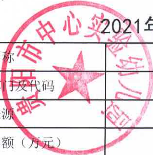
2021年项目支出绩效目标批复表（项目二）