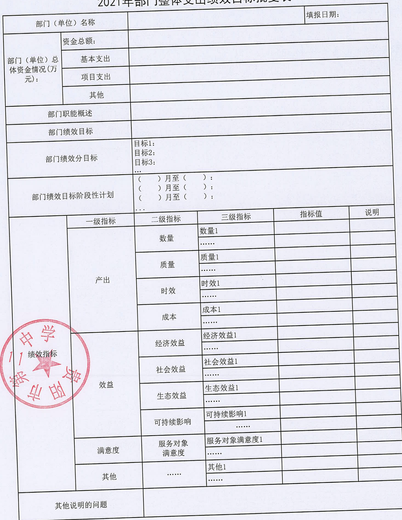
2021年部门整体支出绩效目标批复表