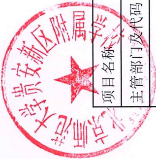
2024年项目支出绩效目标批复表（项目一）