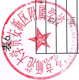
2024年一般公共预算基本支出预算表（按部门预算经济科目）