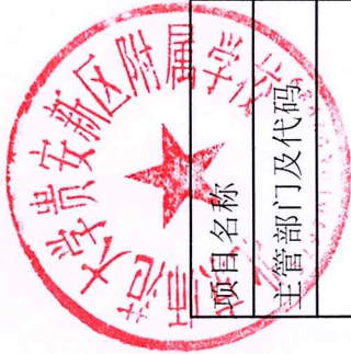
2024年项目支出绩效目标批复表（项目二）